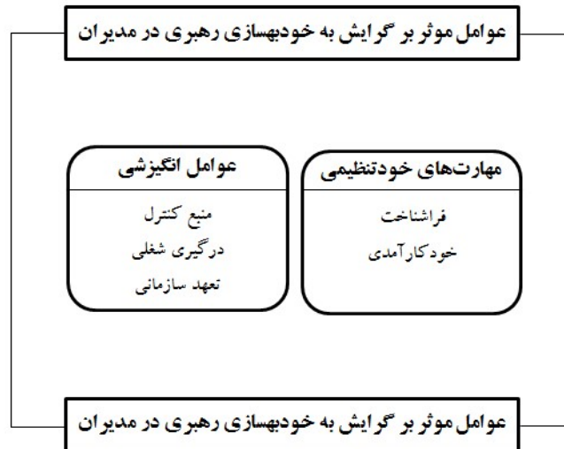
شکل 1. مدل مفهومی تحقیق

خودبهبودی رهبری متناسب با ماهیت متغیرها و شیوه قضاوت انسانی در مدارس دولتی شهر اصفهان، موجبات نوآوری را فراهم ساخته است. به منظور نیل به اهداف فوق و با بهره‌مندی از رویکرد داده‌کاوی، مقاله حاضر در صدد پاسخ به این سوال است که طراحی مدل خودبهبودی رهبری در مدیران مدارس دولتی شهر اصفهان چگونه است؟