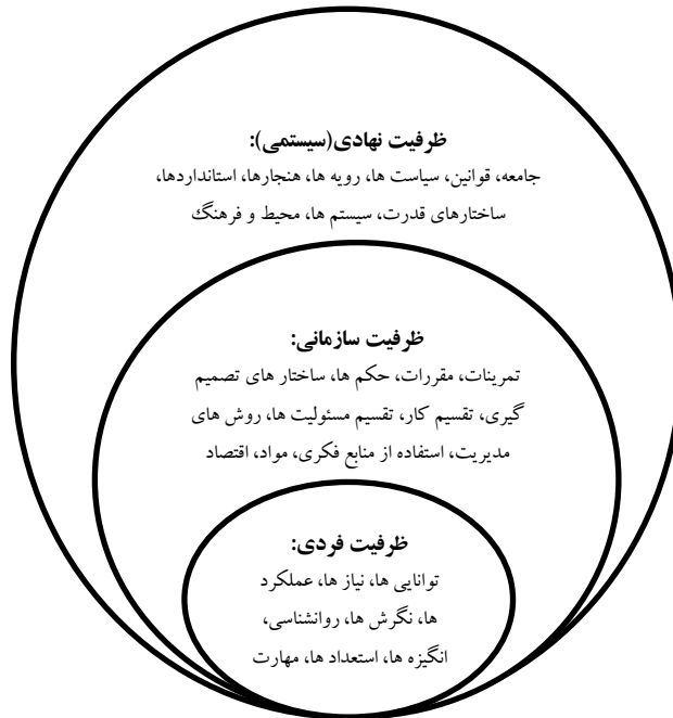
شکل ۱. سطوح و درهم‌تنیدگی ظرفیت و توسعه