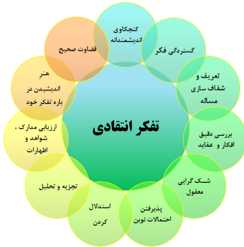
شکل ۱: مؤلفه‌های یازده گانه تفکر انتقادی بر اساس مبانی نظری پژوهش

در رابطه با جایگاه تفکر انتقادی در کتاب درسی تاریخ معاصر ایران در مقطع متوسطه، تحقیق و یا پژوهشی که به‌طور مستقیم به این موضوع پرداخته باشد، یافت نشد اما درعین حال تحقیقات مختلفی درباره‌ی جایگاه تفکر انتقادی در دروس، پایه‌ها و مقاطع دیگر انجام شده که در اینجا به برخی از آنها اشاره می‌شود: